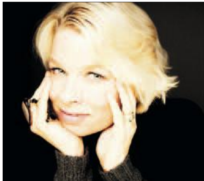
PÅ GODT OG VONDT: Linn Ullmann.

Dette er historien: Sommeren 2008 reiser Jon og Siri med barna Liv og Alma til Mailund, Siris barndomshjem. De har pleid å tilbringe somrene her, men dette året har de også med seg Mille. Hun er 19 år, og skal passe barna. Planen er at Jon, som har skrivesperre, omsider skal få skrevet ferdig boka han har slept meg seg i flere år. Siri vil bare ha noen timer om dagen på restauranten hun driver her. Men det blir komplisert, det hele. Siri irriterer seg over Mille, alt hun sier, alt hun gjør, mens Jon ... Jon er betatt. Det hører med til historien at Jon stadig er utro mot Siri, og at det, til tross for øyeblikk av ømhet, har lagt seg en kulde mellom dem. Denne sommeren fyller Jenny, moren til Siri, 75 år. Under feiringen forsvinner Mille. To år senere blir restene av henne funnet nedgravd i skogen. Jeg kan avsløre dét, fordi det er her,