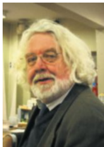
EDVARD HOEM: Nytt kraftverk.