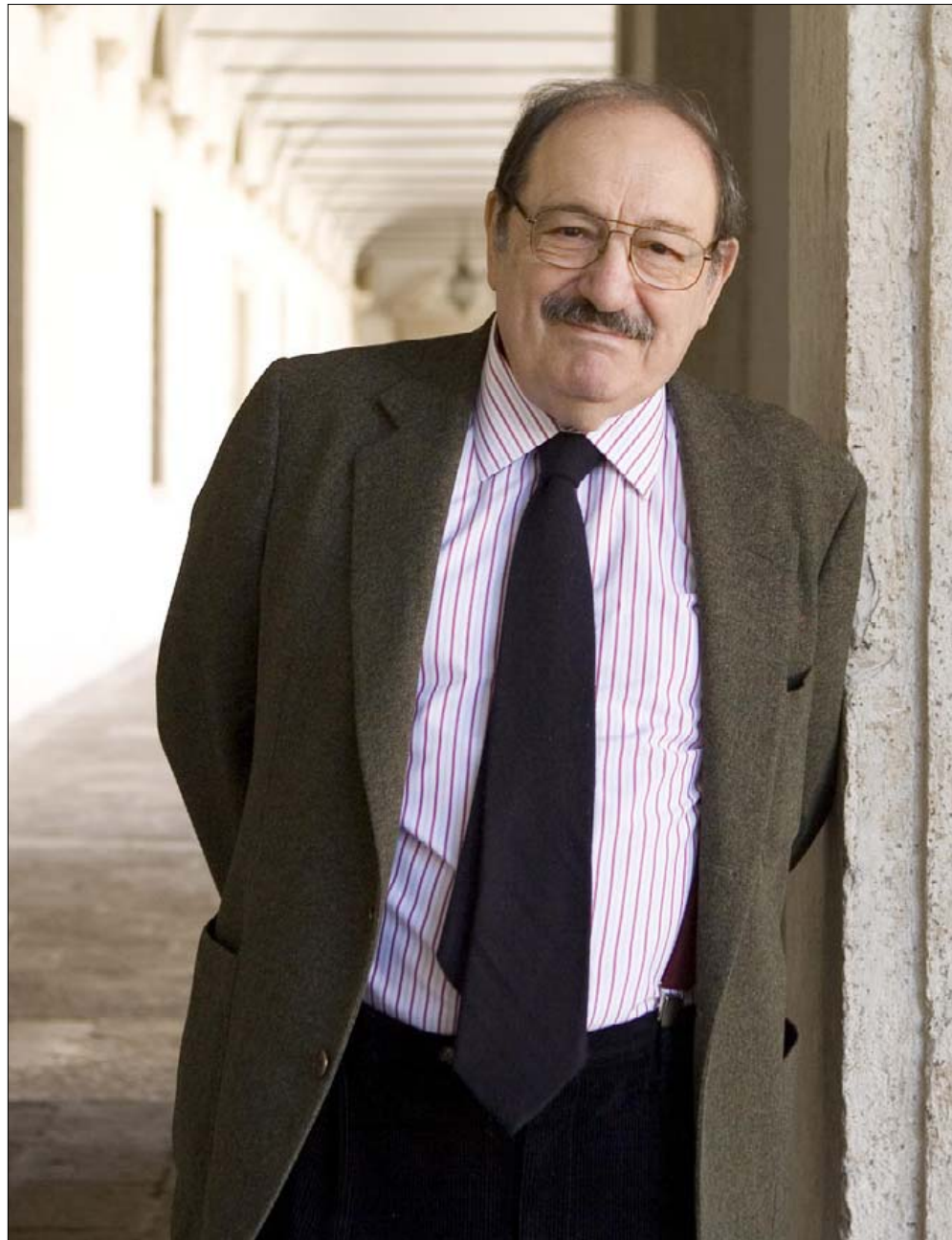
Umberto Ecos seneste storværk er værd at kaste sig over.