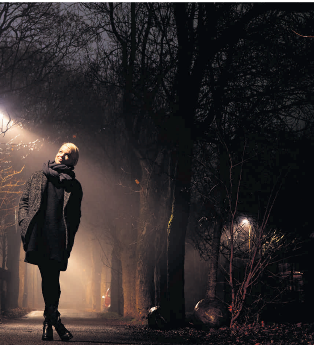
net de berømte foreldrene - starter ganske annerledes enn de fleste andre norske selvbiografier.