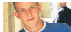
Edouard Louis