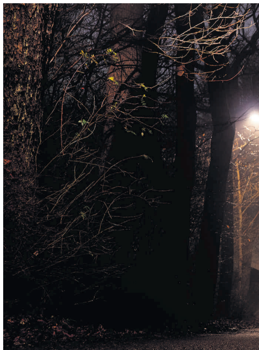
SELVBIOGRAFISK: Linn Ullmanns nye bok er en selvbiografisk roman, som - grun-

Fortellingen veksler mellom ferieopp- hold hos faren og hans siste kone på Hammars, og livet med moren på Strømmen, i Oslo og USA. Skarpt tegner Ullmann opp forskjellene mellom