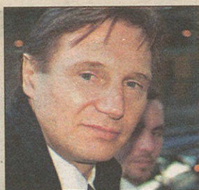
MO: Liam Neeson

- Dronningen spurte om jeg hadde fått ordenen for teaterarbeidet eller for filmkarrieren. Jeg svarte at jeg trodde det var for begge.