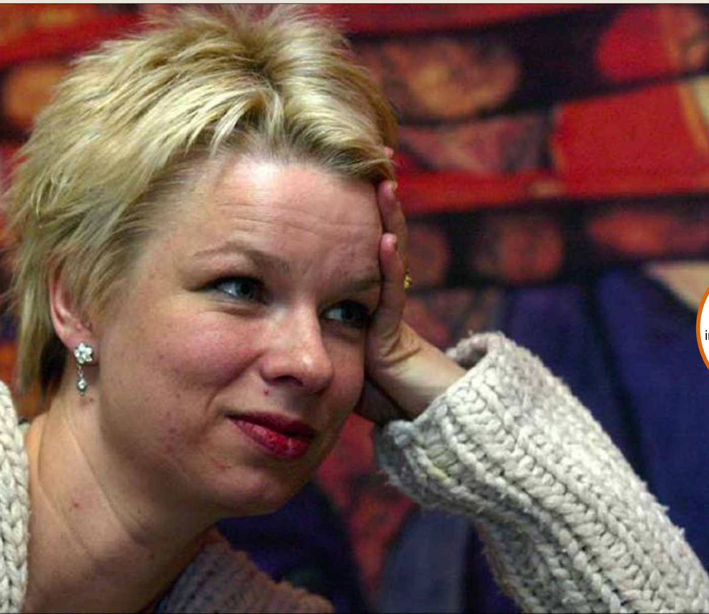
ns femte roman. Boken er befolket med særegne personligheter som man veksler mellom å føle sympati og antipati for, skriver vår anmelder.

forlaget nærmer seg en million. (Dette er pussig nok andre gang på kort tid at jeg leser om forfattere som skylder enorme summer til forlag for bøker de ikke har skrevet. I «Min kamp 6» forteller Karl Ove Knausgård om en skyld til forlaget på nærmere 700 000. Har forlagene som