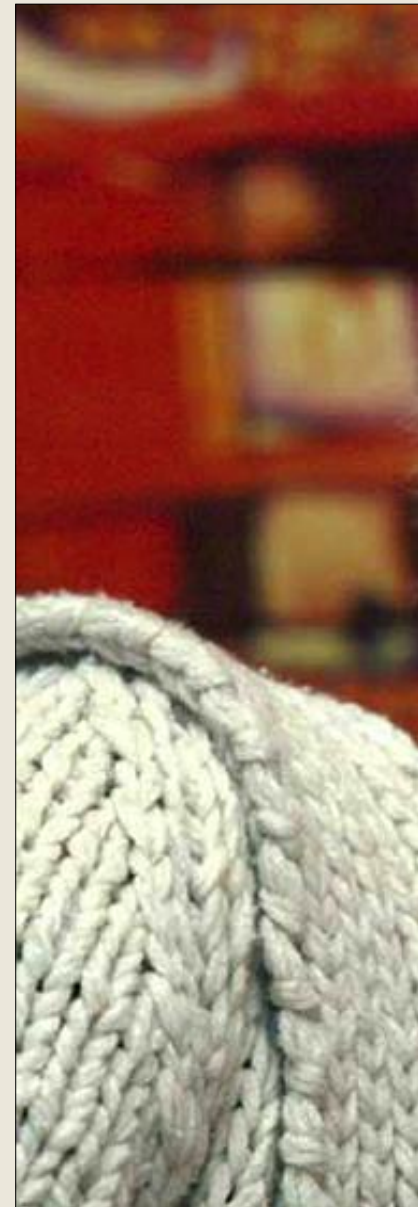
NUMMER FEM: «Det dyrebare» er Linn Ullmann

Linn Ullmann «Det dyrebare» Oktober forlag Sinnrik og sår roman om taushet